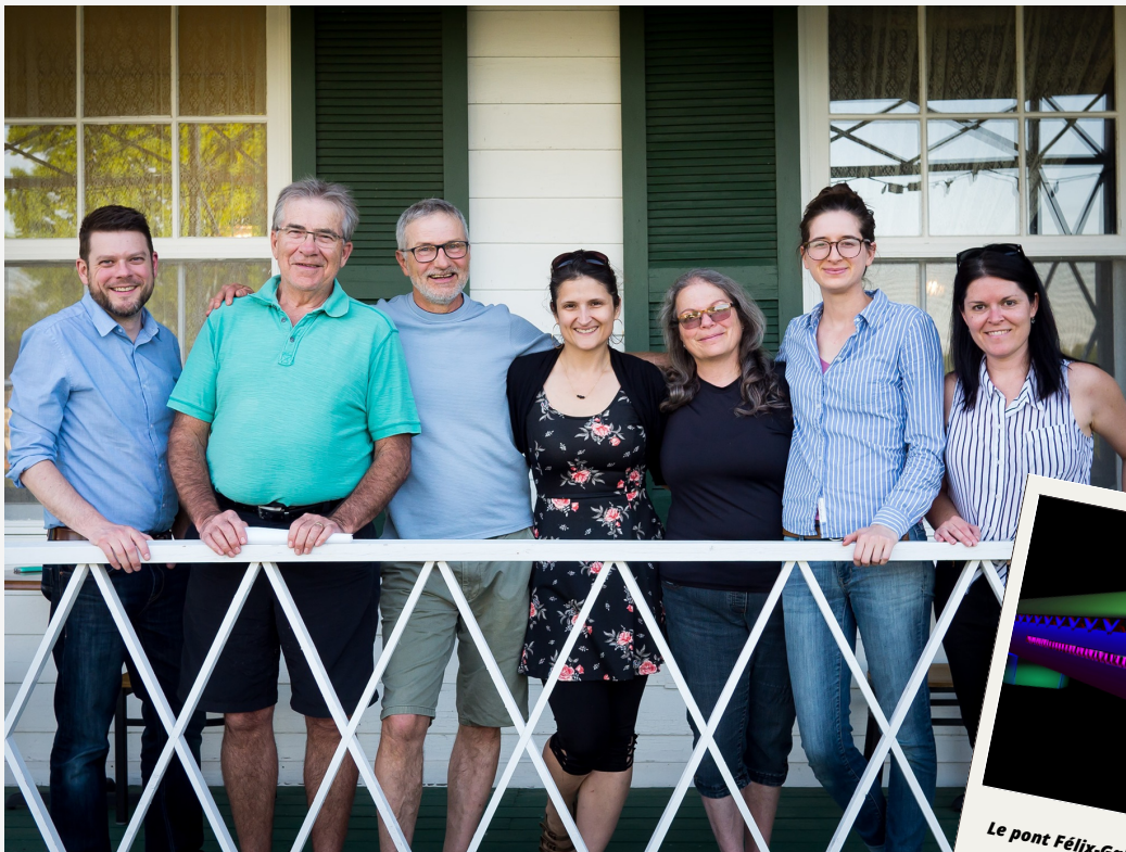
L'équipe de Phare Ouest