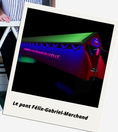
Le pont Félix-Gabriel-Marchand

Comme projet alliant loisir culturel et patrimoine, nous décernons notre coup de cœur à Phare Ouest pour l'illumination du Pont Félix-Gabriel-Marchand. Officiellement inauguré le 20 mai dernier à Mansfield-et-Pontefract, le projet est un bel exemple d'innovation en loisir culturel et de mise en valeur du patrimoine bâti. De nombreux partenaires se sont réunis afin de mettre sur pied ce projet hors du commun. Depuis son ouverture, les résidents et visiteurs peuvent observer le pont rouge la nuit et contrôler les lumières et leurs couleurs grâce à une application mobile.